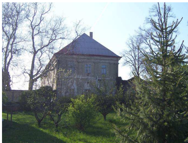
Bývalá jezuitská rezidence