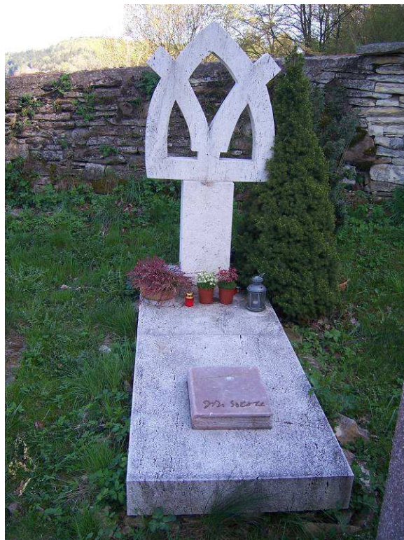
Hrob Jiřího Šotoly v Janovičkách u Luže.