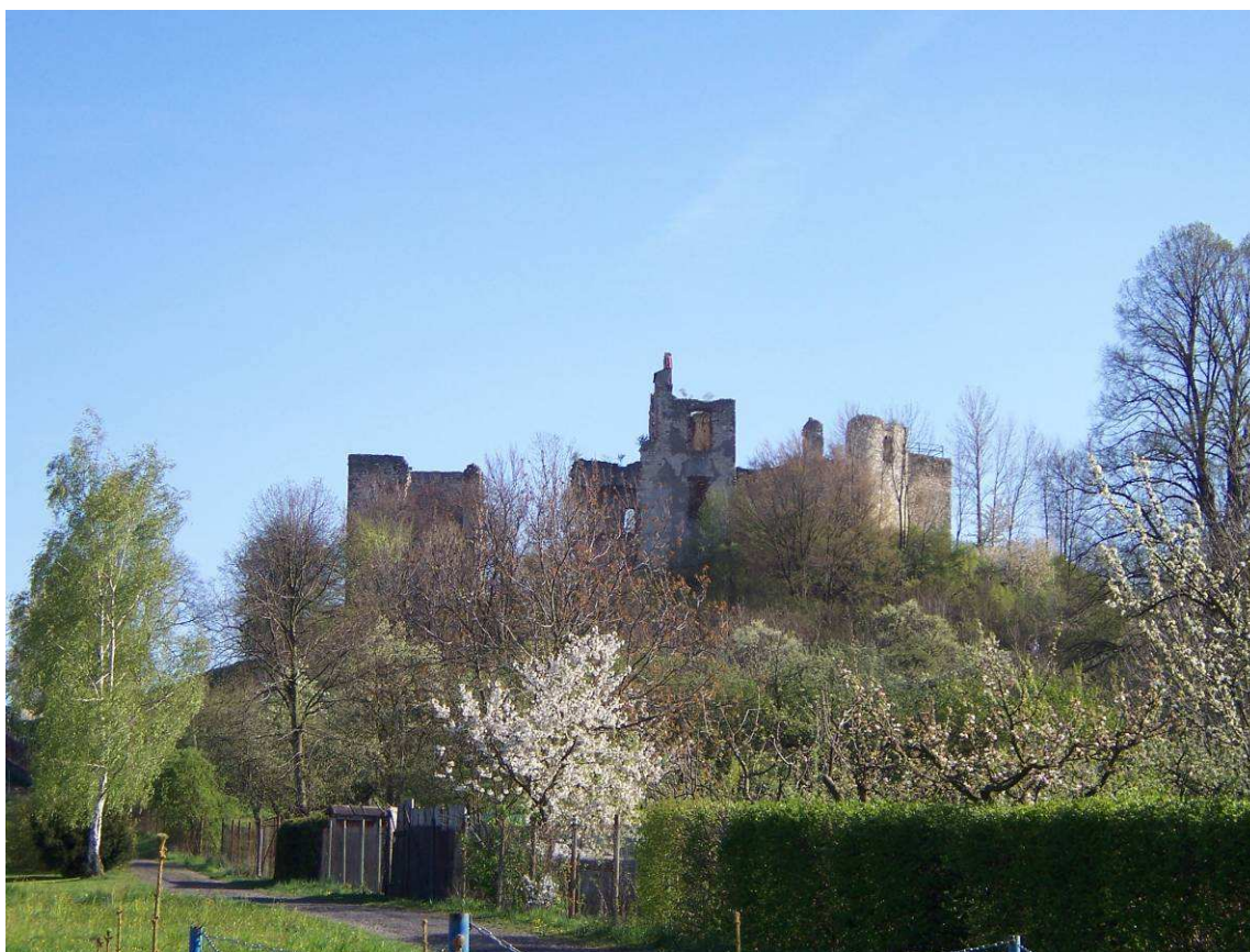
Zřícenina hradu Košumberka.