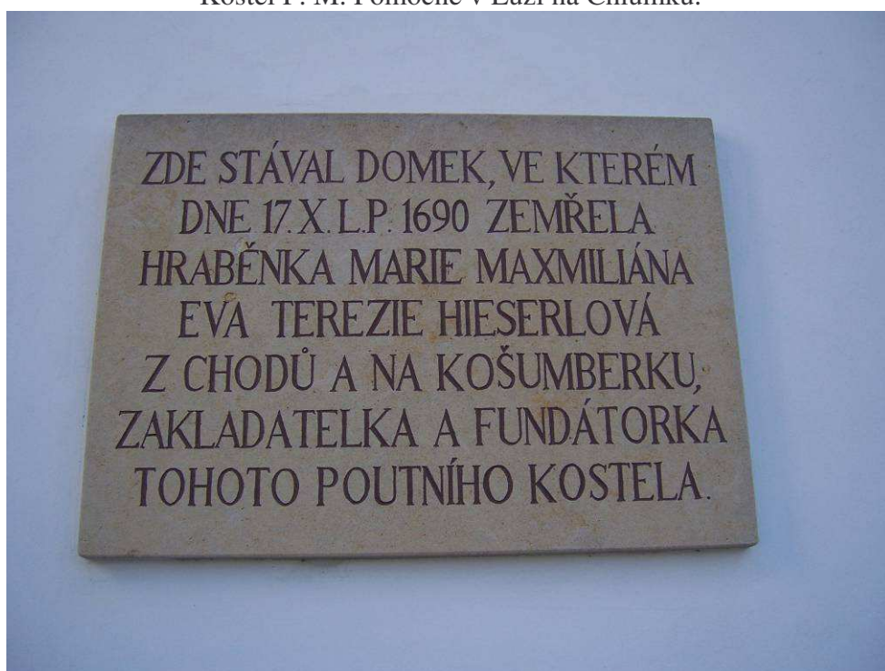
Pamětní deska hraběnky Hieserlové.